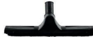
HALI SÜPÜRME APARATI