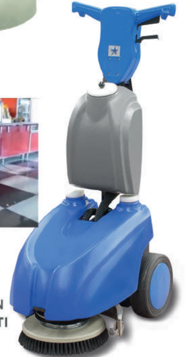
DAR ALAN TEMİZLEME OTOMATI