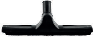
HALI SÜPÜRME APARATI