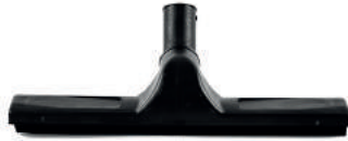
SU ÇEKME APARATI