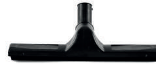
SU ÇEKME APARATI