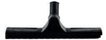
SERT ZEMİN SÜPÜRME