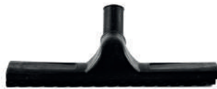
SERT ZEMİN SÜPÜRME